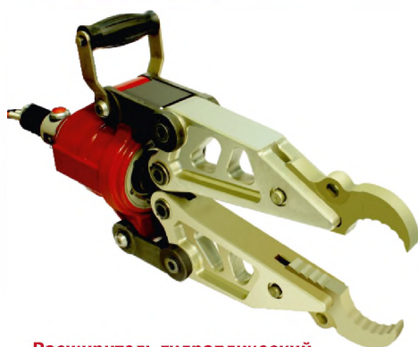
Расширитель гидравлический Р580-Э4

Максимальная величина разжима – 580 мм Масса – 17 кг