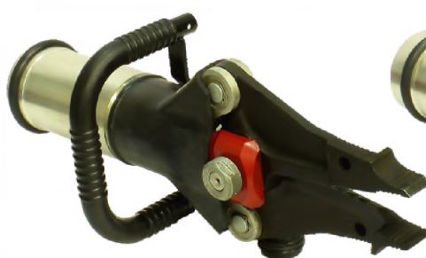
Ножницы универсальные комбинированные гидравлические НУК25/235-Э4

Максимальная величина разжима – 580 мм Масса – 17 кг