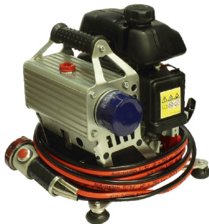
Насосная бензиновая станция с распределителем НБР18/82-35-Э4 в комплекте с БУ-Э4 и РВД3000-Э4