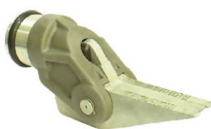
Расширитель гидравлический Р80-Э4

Давление – 80 МПа Объем бака – 0,3 л Масса – 2,5 кг