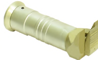
Расширитель гидравлический РУ80-Э4

Минирасширитель с величиной разжима до – 80 мм Масса – 4,5 кг