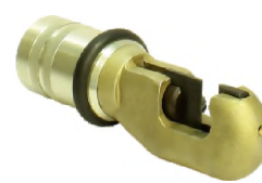
Кусачки гидравлические К18-Э4

Минирасширитель угловой с величиной разжима до – 80мм Масса – 3,2 кг