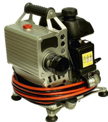
Насосная бензиновая станция с распределителем НБР18/82-50-Э4 в комплекте с БУ-Э4 и РВД3000-Э4