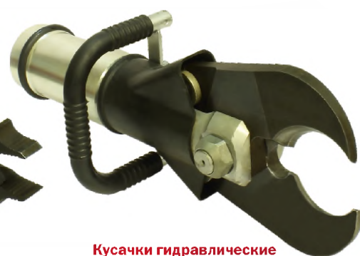
Кусачки гидравлические К30-Э4

Диаметр перекусываемого прутка – до 25 мм Максимальная величина разжима – 235 мм Усилие стягивания – 4,2 тс Усилие расширения – 3 тс Масса – 9 кг