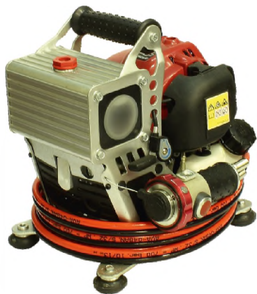
Насосная бензиновая станция с распределителем НБР18/82-25Р-Э4 ранцевая в комплекте с БУ-Э4 и РВД3000-Э4