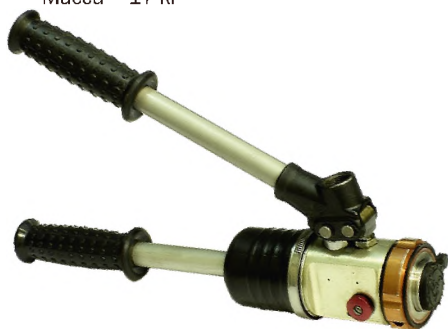
Насос ручной гидравлический НРГ8003-Э4

Диаметр перекусываемого прутка до – 30 мм Масса – 12 кг